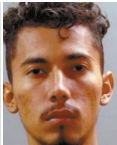
por la mañana. Ambos fueron puestos en libertad sin fianza.